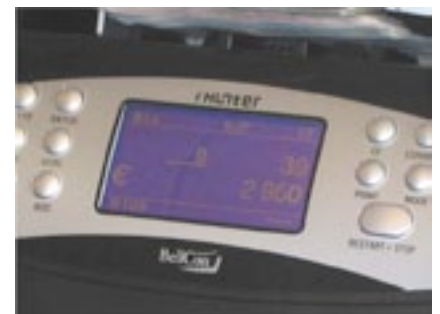
Groot LCD scherm verstrekt duidelijk en goed leesbaar alle benodigde informatie